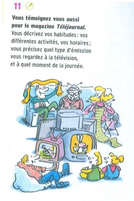
شکل ۳: Alter ego 1 (درس چهارم)

نمونه پایانی از روش «آلتر اگو ۱ »، در شکل ۳، به نمایش درآمده است. همان‌گونه که مشاهده می‌شود، این تصویر برای کمک به حل یک تمرین آموزشی یا همان «فعالیت» آورده شده است که مشابه فعالیتی واقعی در میان گویشوران این زبان است.