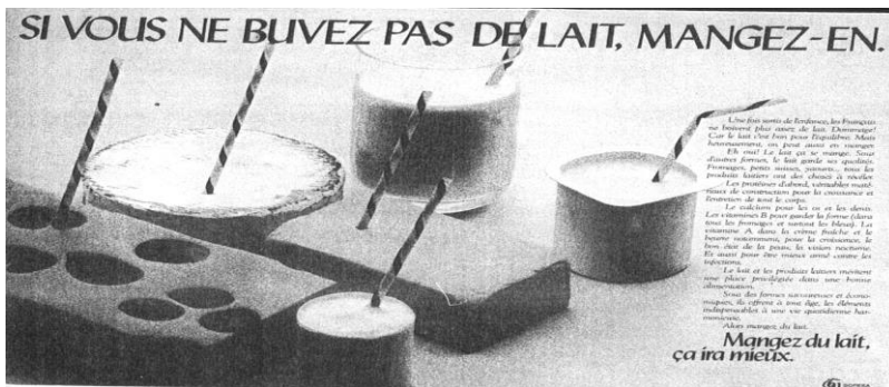
شکل ۴: Archipel1 (درس پنجم)

شنیداری-دیداری آمده‌است، آن‌ها را «تصور» می‌کند. همان‌گونه که پیش از این نیز اشاره شد، به باور این دو پژوهشگر آموزش زبان، تصویر در روش شنیداری-دیداری برای تجسم کردن جمله در پیوند با کاربرد آن است. روش تصور موقعیت که از حوزه تبلیغات برگرفته شده‌است، به یقین، سبب به وجود آمدن ارتباط‌های کلامی میان زبان‌آموزهایی می‌شود که از «قدرت تصور» خود بهره می‌برند. به این ترتیب، در رویکرد مورد نظر «تخیل» و فرآورده آن «تصور» به کار می‌آیند. (همان)