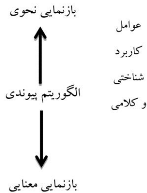
شکل ۱: نظام دستور نقش و ارجاع

الگوریتم پیوندی دوسویه تعامل میان بازنمایی نحوی و معنای را از دید گوینده (معناشناسی به نحو) و شنونده (نحو به معناشناسی) توصیف می‌کند. نکته حائز اهمیت این است که دوسویه بودن الگوریتم پیوندی به معنای گشتاری بودن فرایند پیوند نیست. به عبارت بهتر، هیچ نوع صورت روساختی و ژرف ساختی وجود ندارد. همچنین مفاهیم انتزاعی مانند PRO، ردها، افعال سبک و غیره در این دستور جایی ندارد. در حقیقت، دوسویه بودن پیوند میان بازنمایی‌های نحوی و معنایی امکان بررسی پاره گفتاری را از دو زاویه دید فراهم می‌سازد.