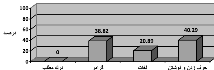
نمودار شماره ۱

ارزشیابی توانش شفاهی نشان داد که مبتدیان کاذب ۱ تقریباً هیچ مشکلی در تلفظ و بیان شفاهی نداشته‌اند، در حالیکه تنها ۳۰٪ از مبتدیان واقعی کلمات را به درستی تلفظ می‌کردند و ۷۰٪ بقیه در تلفظ صحیح کلمات با مشکل مواجه بودند.